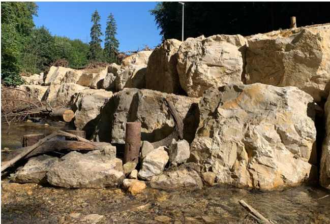
Gestaltungssteine Melliker Kalkstein, zyklisch, formwild