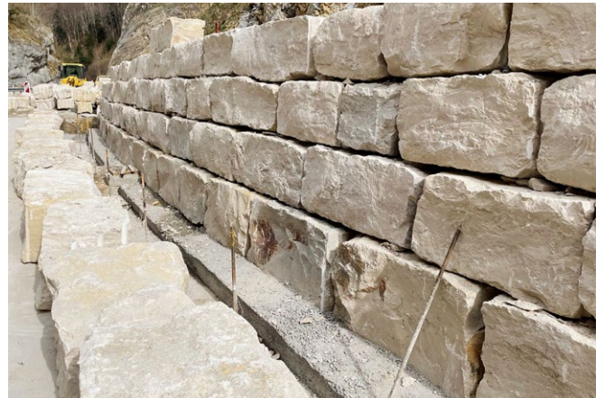
Gestaltungssteine, Dietfurter Gala gerichtet