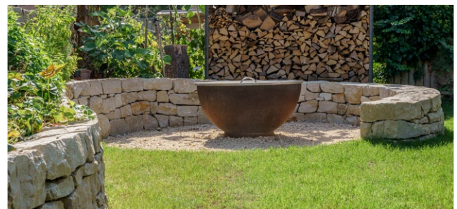
Melliker Kleinmauersteine grob gerichtet