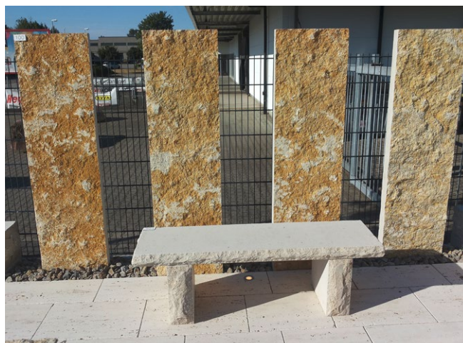
Krustenplatte Jurakalkstein als Stelen

Hinweis: Spaltphyllit kann sich, bedingt durch Oxidation, rostbraun verfärben.