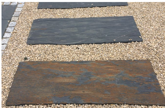
Spaltphyllit als Bodenplatte