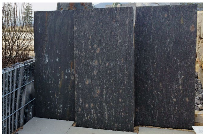
Spaltphyllit-Palisaden als Sichtschutz