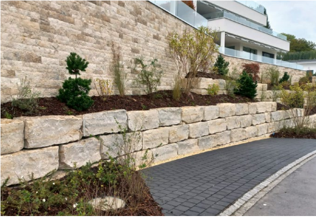
Gestaltungssteine, Dietfurter Gala gerichtet