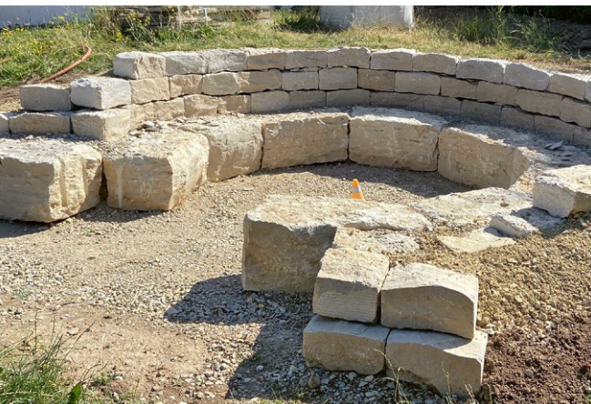
Gestaltungssteine, Dietfurter Gala gerichtet