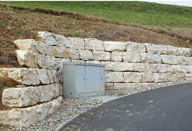
Gestaltungssteine Dietfurter Gala Frontseite gerichtet