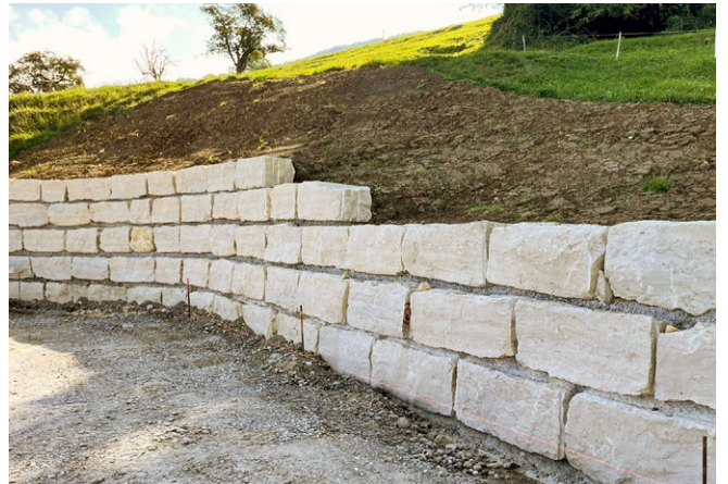
Gestaltungssteine, Dietfurter Gala gerichtet