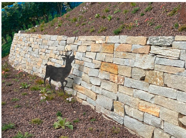
Kleinmauersteine, Tessinergneis (Luserna)