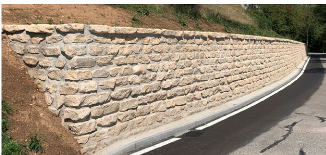
Dietfurter Kleinmauersteine, plattig