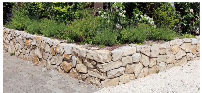
Melliker Kleinmauersteine, zyklopisch