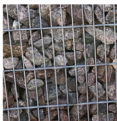
Schwarzwald Granit grau-braun-rot 60 - 120 mm