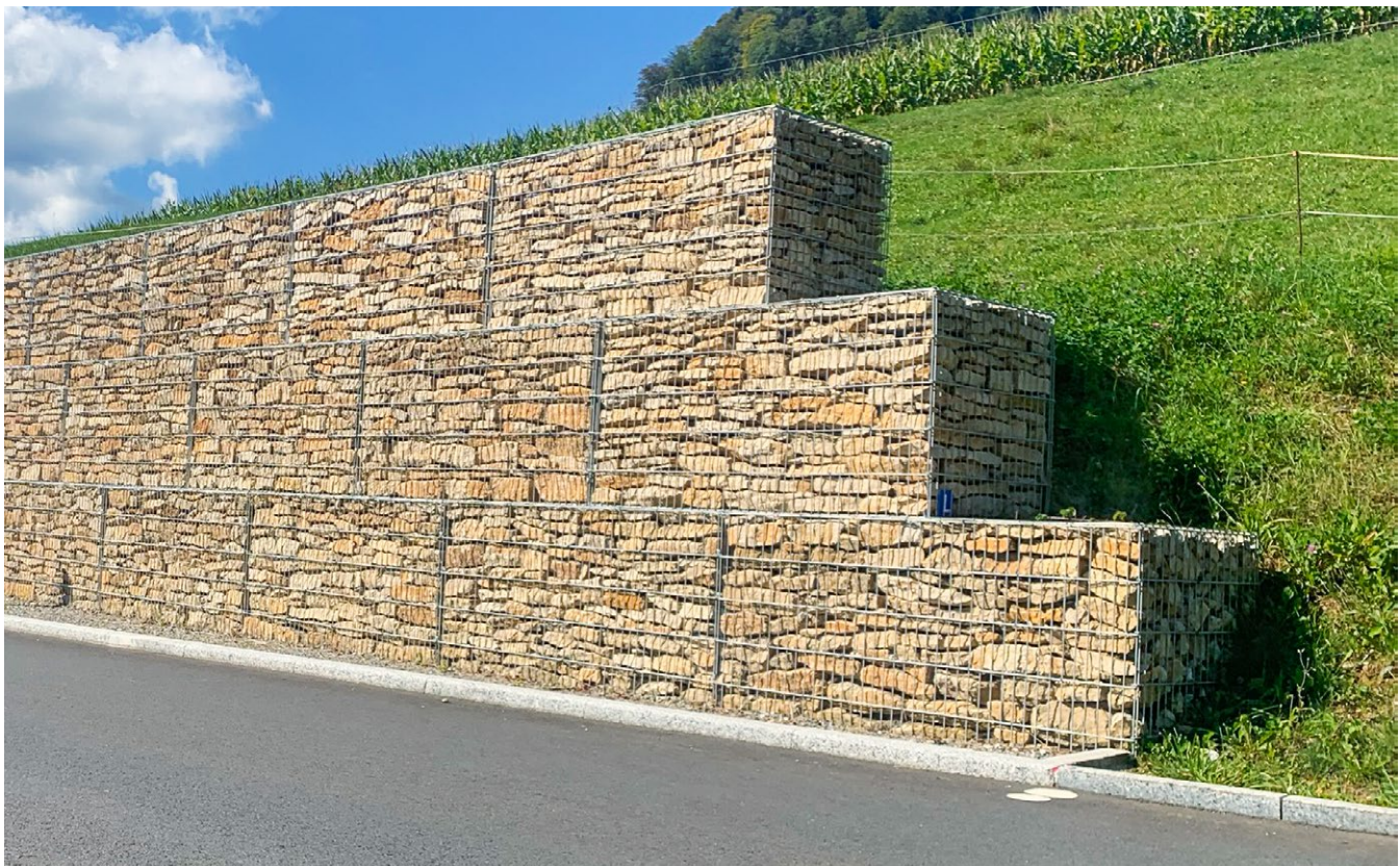
Steinkörbe als Hangverbauung, Ansichtsfläche mit Schichtmauerwerk