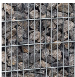
Alpenkalk grau 63 - 120 mm