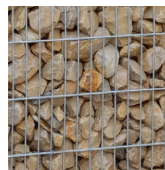
Jurakalk beige 60 - 140 mm