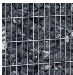
Alpenkalk schwarz-weiss 80 - 120 mm