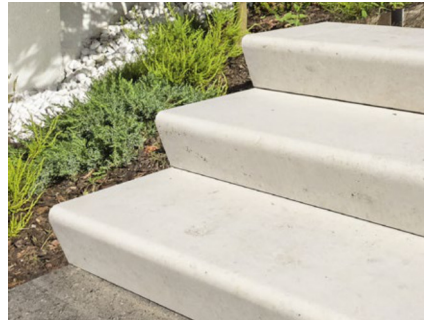
Blockstufe Rondo, auf Anfrage