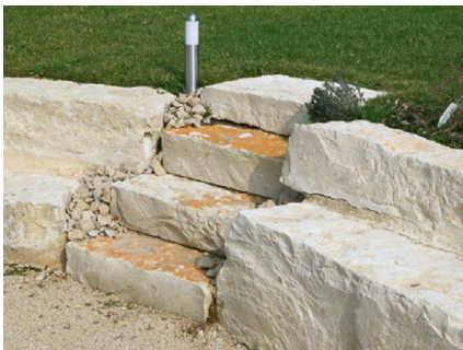
Blockstufen roh gespalten