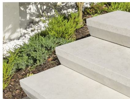
Blockstufe Piazza, auf Anfrage